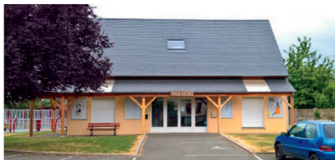
Mairie de Cormeilles, aide au développement des énergies renouvelables via la pose de panneaux photovoltaïques.