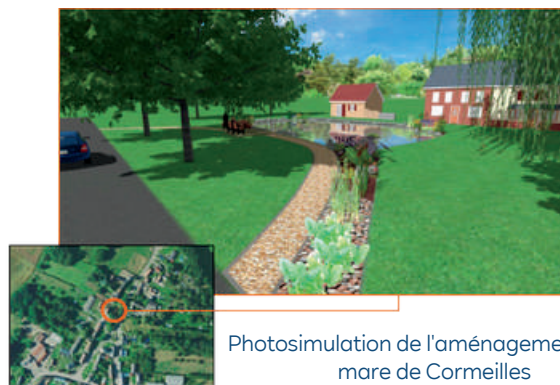
Photosimulation de l'aménagement de la mare de Cormeilles